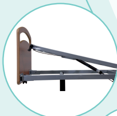
Relève-jambes vérin gaz