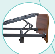
Relève-jambes à crémaillères