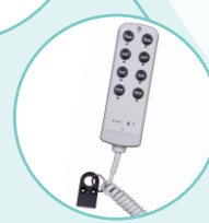
Télécommande verrouillable par clé magnétique

Le lit ne doit pas être utilisé pour des patients dont l'âge est inférieur à 12 ans ou dont la taille est inférieure à 146cm The bed must not be used by patients under 12 years of age, or by patients with body size is less than 146 cm